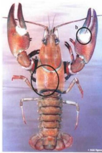
1. attēls. Signālvēzis